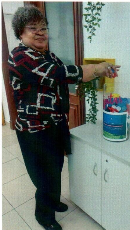
Servidora pública de la división de correspondencia