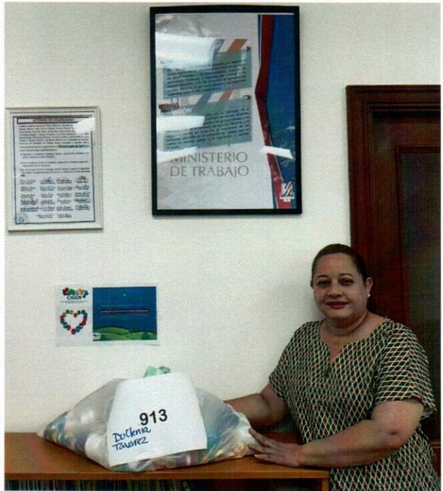
Servidora de la Dirección de igualdad y oportunidades